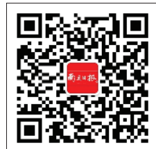
南通日报微信 二维码

不忘初心,继续前行。南通理工人,正在为把学校建设成为国内知名、特色鲜明的高水平地方性应用型民办本科高校而努力奋斗!·邵鹏琛 侯红梅·