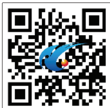
南通网微博 二维码