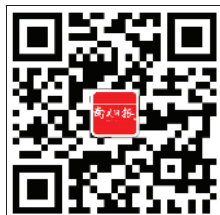
南通日报微博 二维码