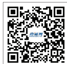
南通网微信 二维码